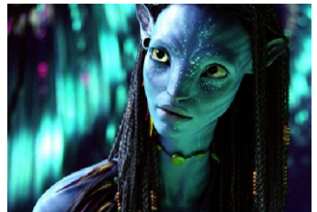
Zoe Saldan as Neytiri in Avatar

The distance from our own reality also allows an easier transition to implausibly corny extremes, as we are initiated into a Gaia-like religion that